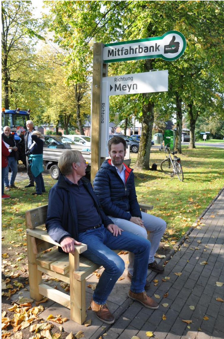
Mitfahrbank in Schafflund bei Flensburg