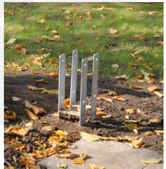
Fundamentierte Pfostenschuhe zur Befestigung